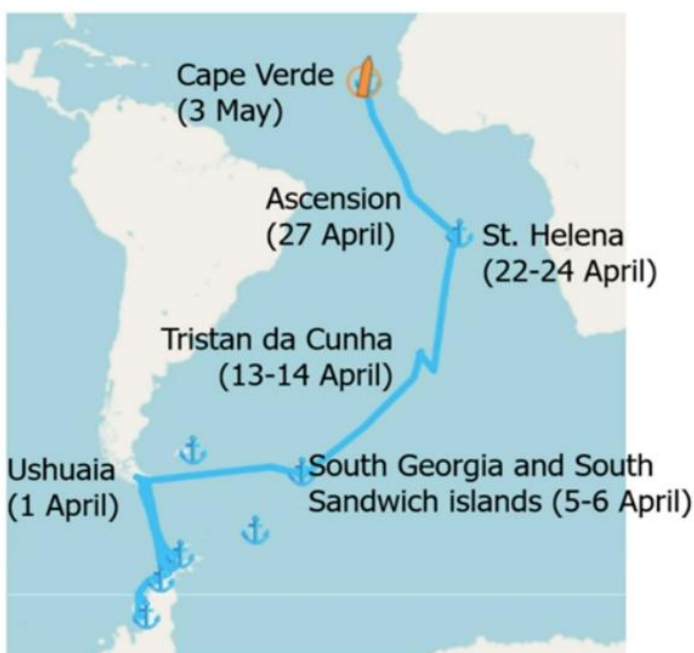
Figura 1. Trayecto del crucero.