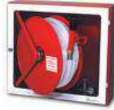
BIE 25 mm