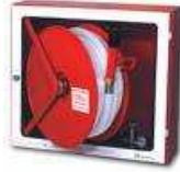
BIE 25 mm.