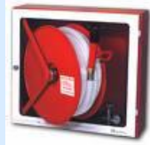
BIE 45 mm