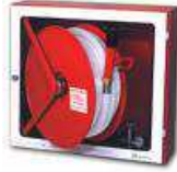
BIE 25 mm