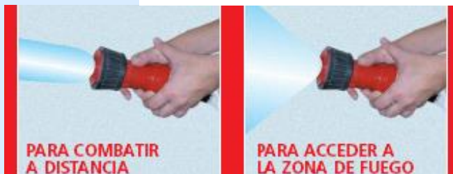
Más alcance. Menos Eficaz

- El chorro se dirigirá sobre la base de las llamas en zig-zag