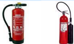
POLVO POLIVALENTE ABC