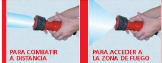
Más alcance. Menos Eficaz