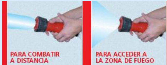
Más alcance. Menos Eficaz