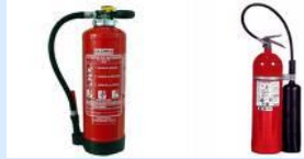
POLVO POLIVALENTE ABC CO2

Comprobar la idoneidad del agente extintor.