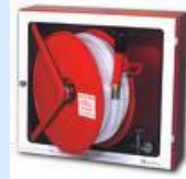
BIE 45 mm